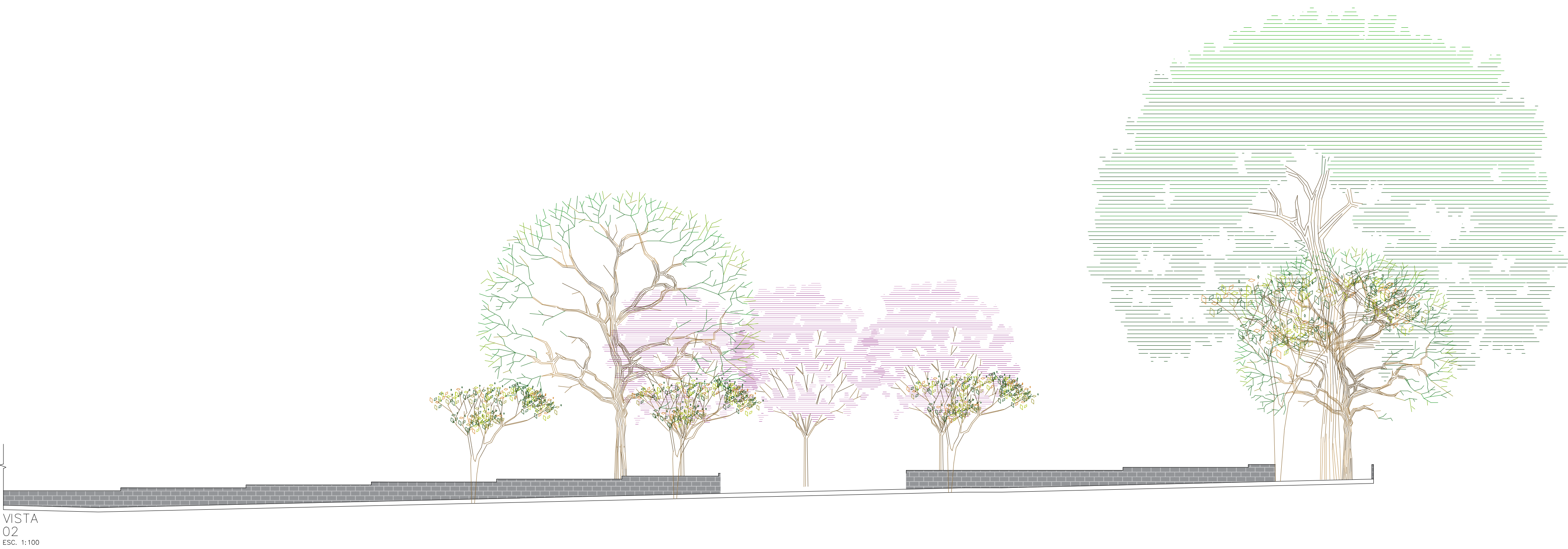
VISTA 02 ESC. 1:100